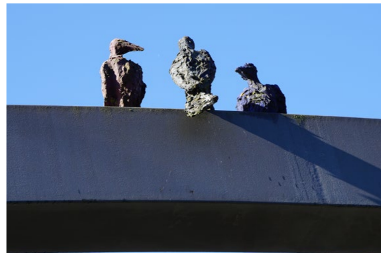
Krähen auf der Brücke über der A1

■ Dauerziele ☑ erfüllt □ in Arbeit ○ nicht erreicht