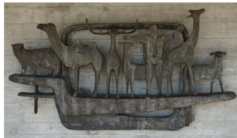
Kunstobjekt Schulhaus Ferenberg

Steigender Sanierungsbedarf an Schulgebäuden infolge Alterung