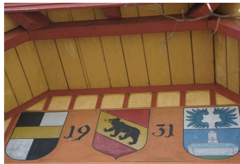
Ehemaliges Schützenhaus Feldschützen Habstetten