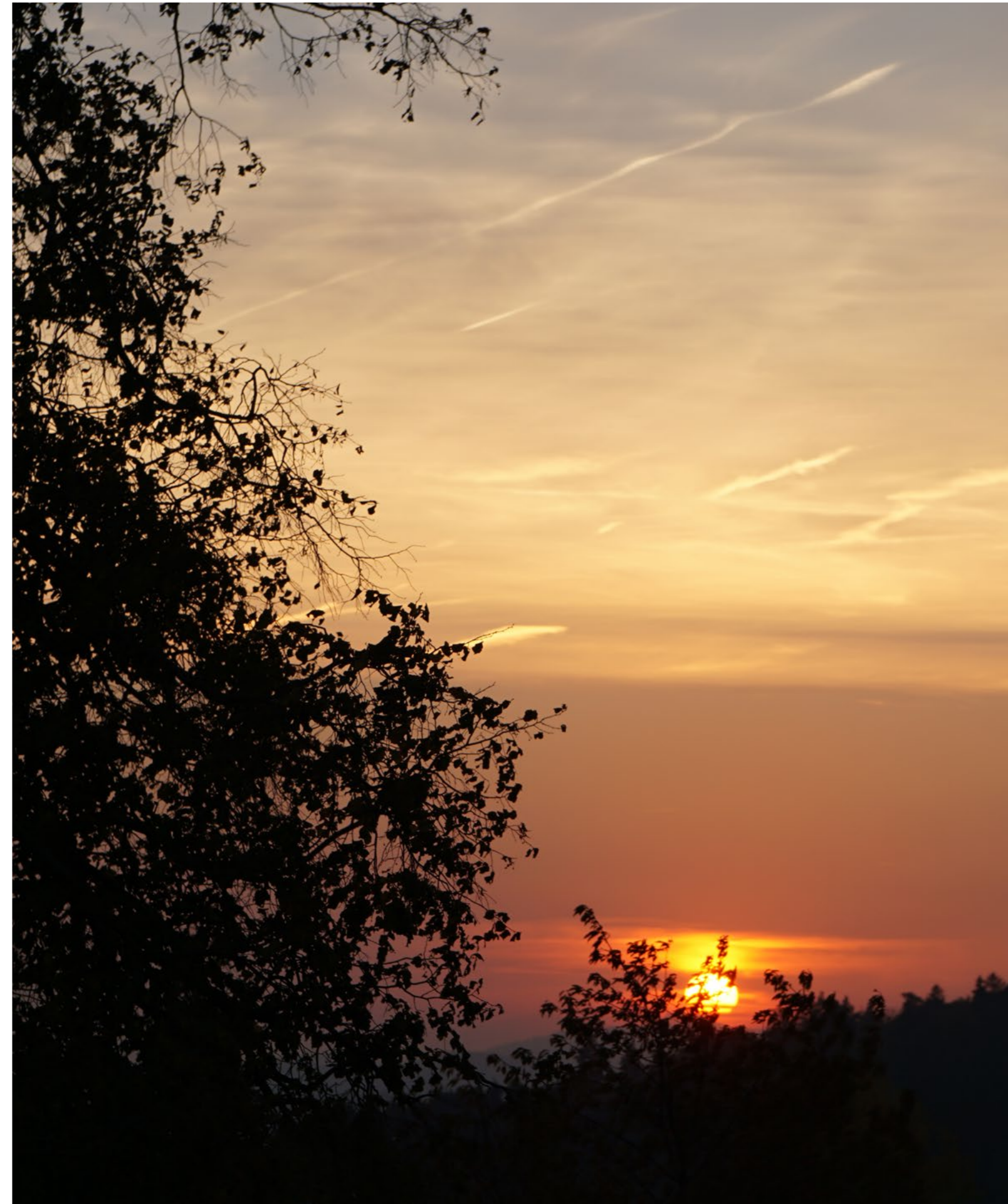
Sonnenuntergang in Habstetten