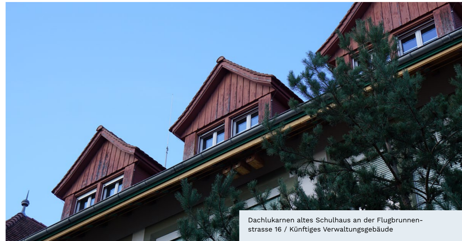
Dachlukarnen altes Schulhaus an der Flugbrunnenstrasse 16 / Künftiges Verwaltungsgebäude