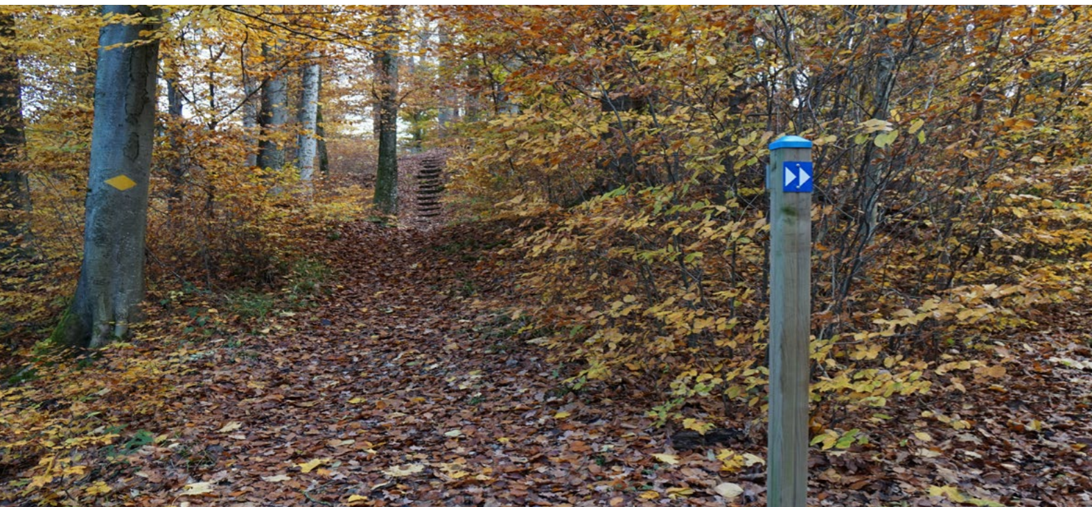
Wegweiser Wanderweg und VitaParcours im Schwandiwald