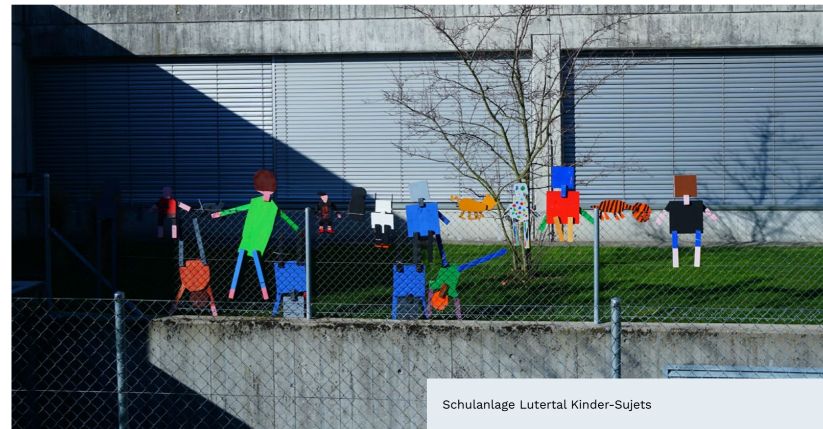
Schulanlage Lutertal Kinder-Sujets