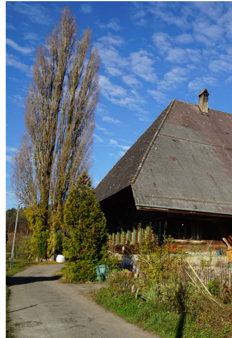
Habstetten Zägli-Bauernhaus (Gemeindeliegenschaft)