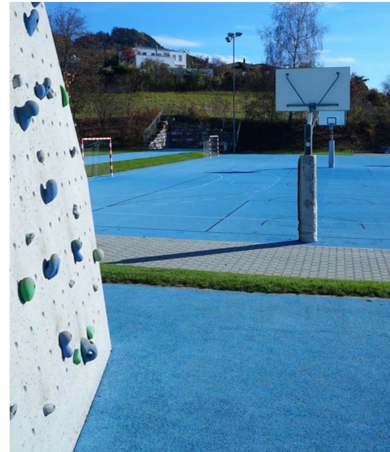
Aussenplatz Schulanlage Lutertal