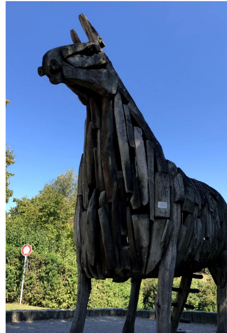
Trojanisches Pferd Schulanlage Lutertal