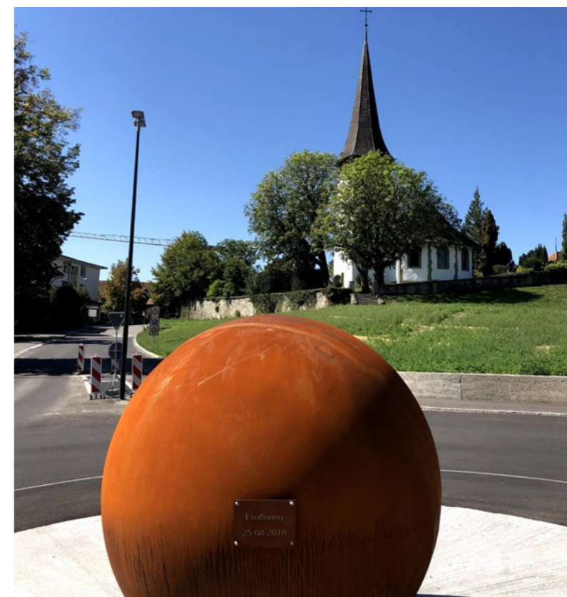
Kugel-Kreiselschmuck Sternenkreuzung mit ref. Kirche