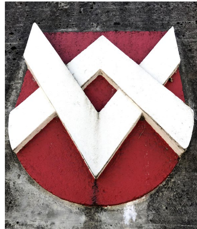
Bolliger Wappen bei der Abzweigung Rörswilstrasse

Nebst den jährlichen Tranchen für den Werterhalt des Leitungsnetzes der Wasser- und Abwasserentsorgung kommen verschiedene Sanierungsprojekte in die Ausführungsphase. Danach wird die Quote für den Werterhalt sinken.