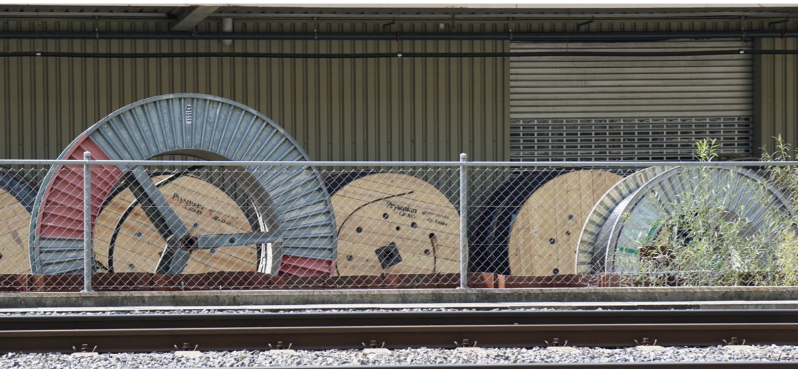
Kabelrollen Firma Kablan Rothusstrasse